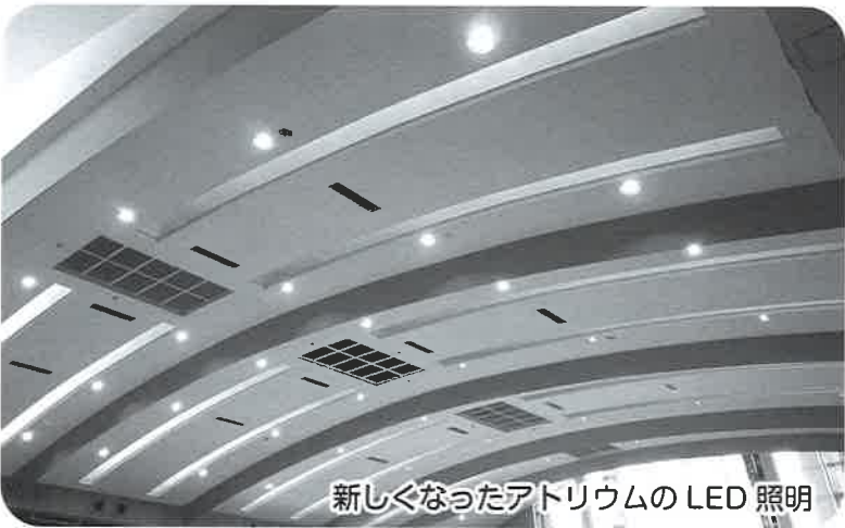
新しくなったアトリウムのLED照明

10月中旬から始まった空調機・LEDの入替工事が、1月26日をもって予定通り終わりました。 今回の工事は、環境省が行う平成30年度の先進対策の効率的実施によるCO 2 排出量大幅削減事業設備補助事業に申請し、数ある申請の中から採択されたものです。当法人の省エネルギー事業の提案が、環境省のお墨付きを得たことになりました。 工事が終わり、アトリウムをご使用されている利用者様からも、「照明が明るくなったね」と声を掛けられ、LED照明は大変好評のようです。明るくなったおかげで、施設も新しくきれいになったような気がします。照明については、比較が難しいのですが、以前の1.5倍は明るくなっていると思われます。