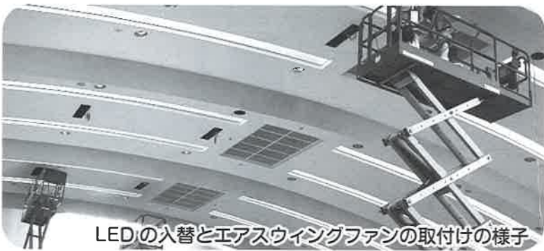
LEDの入替とエアスウィングファンの取付けの様子