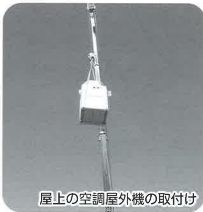
屋上の空調屋外機の取付け

10月中旬から始まった空調機・LEDの入替工事が、1月26日をもって予定通り終わりました。 今回の工事は、環境省が行う平成30年度の先進対策の効率的実施によるCO 2 排出量大幅削減事業設備補助事業に申請し、数ある申請の中から採択されたものです。当法人の省エネルギー事業の提案が、環境省のお墨付きを得たことになりました。 工事が終わり、アトリウムをご使用されている利用者様からも、「照明が明るくなったね」と声を掛けられ、LED照明は大変好評のようです。明るくなったおかげで、施設も新しくきれいになったような気がします。照明については、比較が難しいのですが、以前の1.5倍は明るくなっていると思われます。